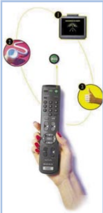
WebTV läßt sich per Fernbedienung steuern, für elektronische Post sollte man jedoch die Infrarottastatur einsetzen