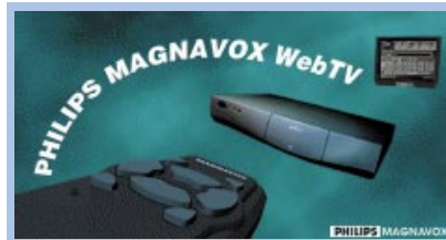
Ein WebTV-Decoder wandelt die Internet-Daten für die Darstellung auf dem Fernsehgerät um

pling-Rate von 44 kHz (eine Audio-CD hat 44,1 KHz) sind dabei möglich, wenn der Datenstrom 30 Kilobit pro Sekunde nicht übersteigt (das Modem schafft in der derzeitigen